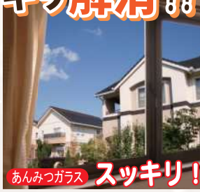
あんみつガラス スッキリ!